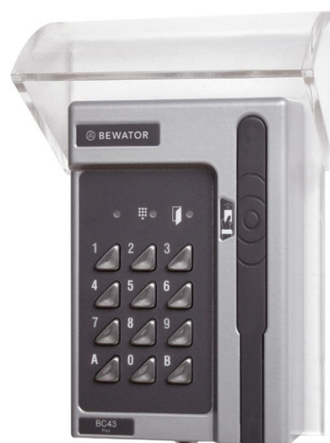
Kortläsare med monterad skyddshuv

Kortläsare BC615 - Hanterar upp till 1000 kort och har anslutning för skrivare eller PC. BC615 har även 15 inbyggda tidscheman.